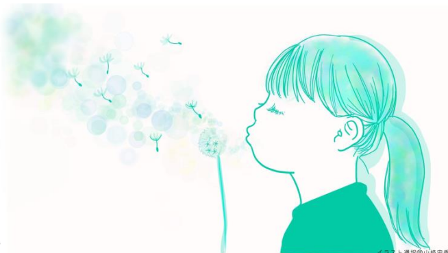
イラスト: 渡辺 山崎 史香